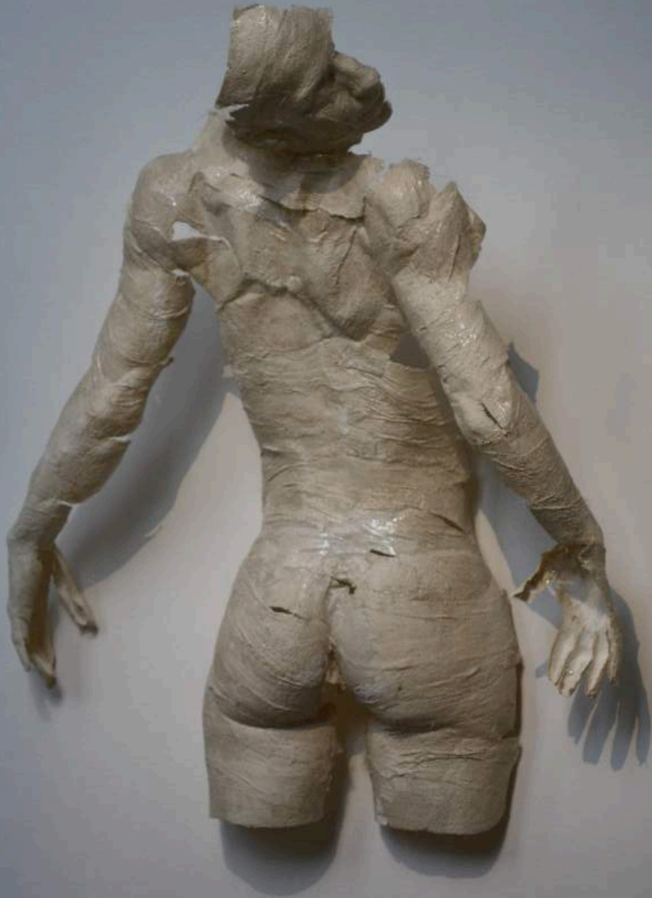
Page de gauche : Sans titre , taille humaine, plâtre résiné