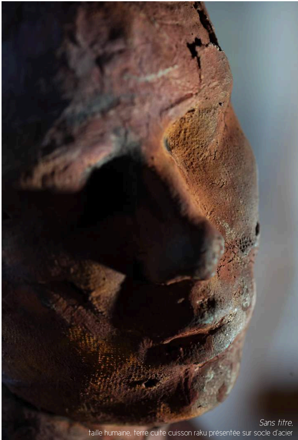
Sans titre, taille humaine, terre cuite cuisson raku présentée sur socle d'acier