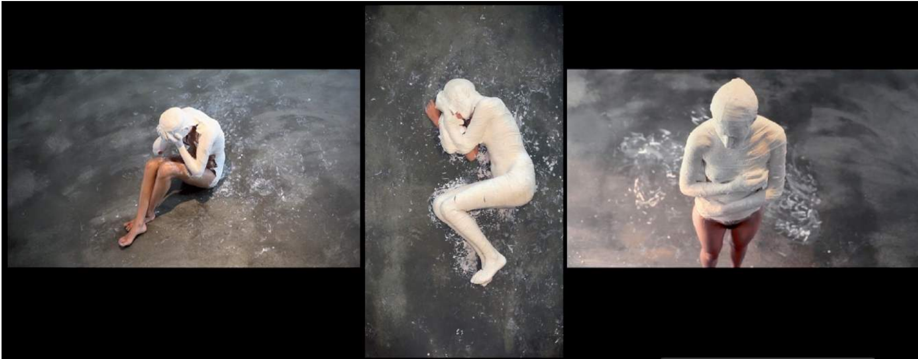
Sans titre , triptyque vidéo

Réalisation : Fanny Alloing Images : Alexandre Alloing Montage et son : Clotilde Gourdon