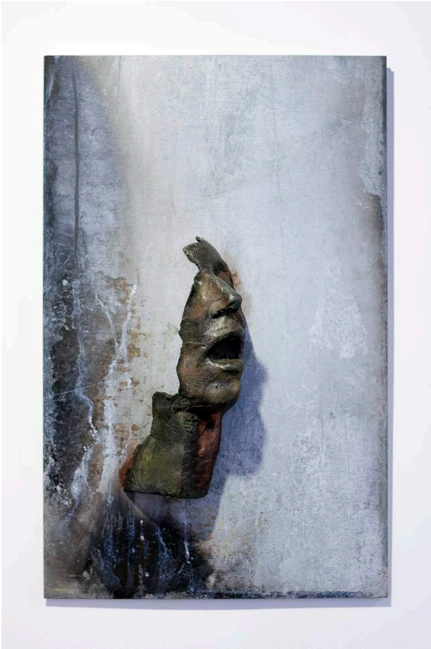
Sans titre. taille humaine, terre cuite cuisson raku présentée sur sur plaque de zinc enfumée