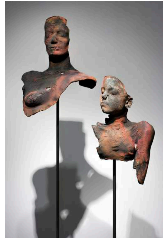
Sans titre, taille humaine, terre cuite cuisson raku présentée sur socle d'acier