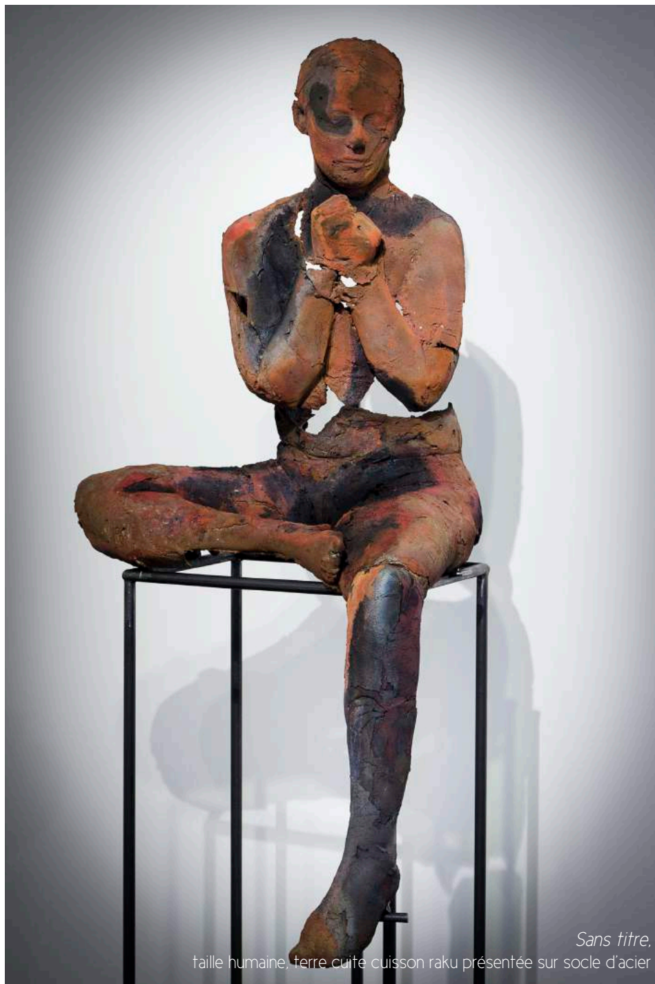
Sans titre. taille humaine, terre cuite cuisson raku présentée sur socle d'acier